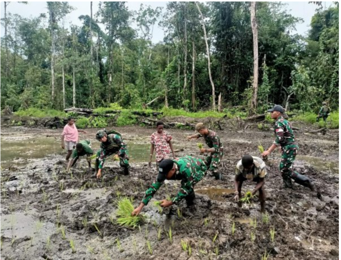
Foto: Satgas Pamtas Mobile RI-PNG Yonif 503/Mayangkara menggalakan program ketahanan pangan yang melibatkan langsung warga Kampung Mumugu, Distrik Krepkuri, Kabupaten Nduga, Selasa (07/01/2025).

NDUGA- Dalam upaya membangun kesejahteraan masyarakat di wilayah